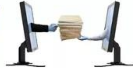
Share paper document from one system to another .