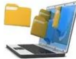
Transfer paper document into digital